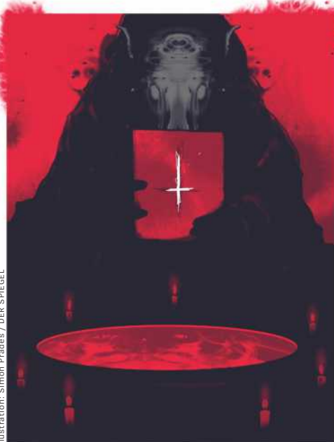
Illustration: Simon Prades / DER SPIEGEL

Weber erinnert sich, weder die Richterin noch sonst irgendjemand habe nach Belegen für die Existenz der Satanisten gefragt. Das Protokoll bestätigt das. »Die haben das alle einfach geglaubt«, sagt Weber.