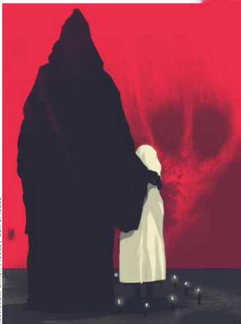
Illustration: Simon Prades / DER SPIEGEL

Im Feld rituelle Gewalt arbeiten etliche Therapeutinnen und Therapeuten mit einem viel weitergehenden Konzept. Demnach hätten Täter Fähigkeiten, eine dissoziative Störung gezielt auszulösen, etwa durch Folter. »Die Sekten unterhalten Ausbildungslager, in denen Persönlichkeitsspaltungen erzeugt werden«, heißt es etwa im Buch »Rituelle