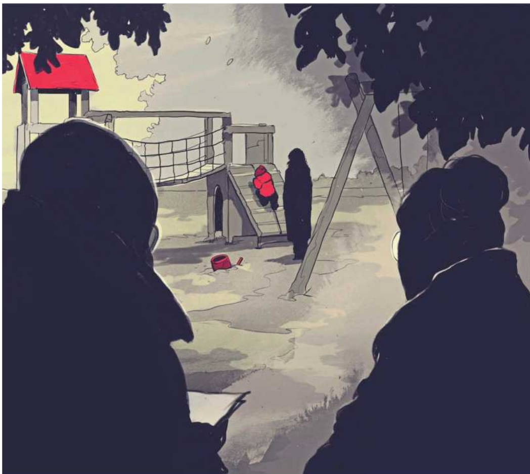
Illustration: Simon Prades / DER SPIEGEL

In der Schweiz erschütterte Ende 2021 eine Fernsehdokumentation die Öffentlichkeit. Der Beitrag »Der Teufel mitten unter uns« des Senders SRF belegt, wie unkritisch Schweizer Psychotherapeuten und Psychiater Pseudowissen über satanisch-rituelle Gewalt und »Mind-Control« übernahmen.